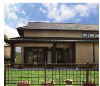
ハネウエル居場所ハウス 岩手県大船渡市

そして、2013年6月には、岩手県大船渡市に、被災地のお年寄りが集い若い世代と交流を持つ場となる「ハネウエル居場所ハウス」の設立をサポート。復興・再建が進む現在も、地元団体およびボランティアにより運営されており、地域住民を迎え入れ、集い、また絆を築く場として活用されています。