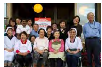
「かまど体験イベント」にて居場所ハウス運営メンバー、地元ボランティアの皆様とハネウエルジャパン社員 (2014年10月)