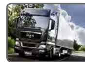
ターボチャージャー