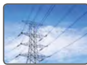
スマートグリッド