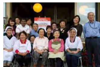
「かまど体験イベント」にて居場所ハウス運営メンバー、地元ボランティアの皆様とハネウェルジャパン社員（2014年10月）