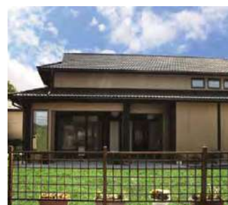
ハネウェル居場所ハウス 岩手県大船渡市

そして、2013年6月には、岩手県大船渡市に、被災地のお年寄りが集い若い世代と交流を持つ場となる「ハネウェル居場所ハウス」の設立をサポート。復興・再建が進む現在も、地元団体およびボランティアにより運営されており、地域住民を迎え入れ、集い、また絆を築く場として活用されています。